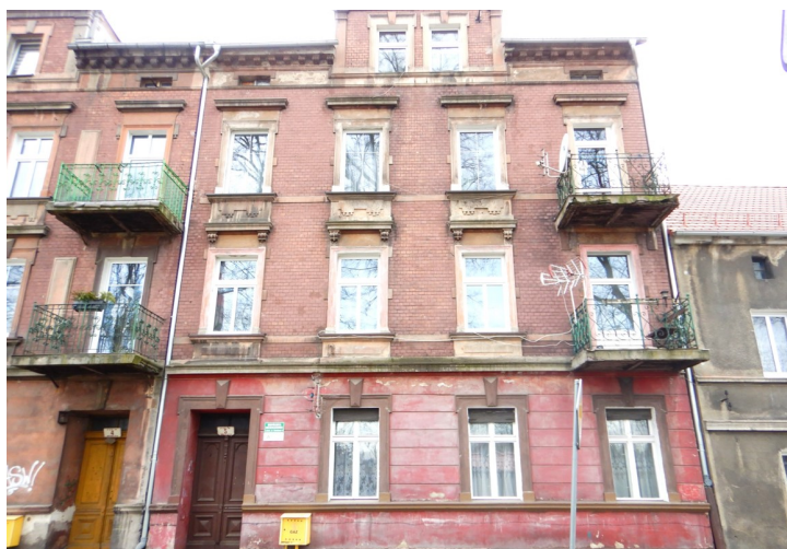
Ogólny widok budynku

na sprzedaż lokalu mieszkalnego Nr 4 znajdującego się w budynku położonym w Lubaniu przy ul. Granicznej 5 wraz z udziałem we współwłasności nieruchomości gruntowej (działka nr 79, AM 3, Obręb III o powierzchni 123 m 2 , JG1L/00017014/3)